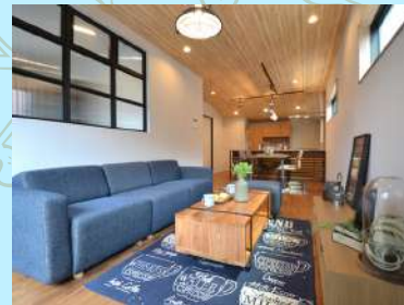
家具・雑貨・照明器具付き

ひとつの空間のなかで一面だけ違うクロスを採用して、空間の中にもおしゃれさを追求しています。アクセントクロスを所々に使用することにより、お部屋ごとで違った表情が楽しめます。