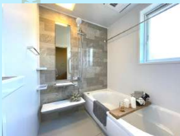
浴室乾燥暖房機付き1坪バス

1坪タイプのバスルームでゆっくりとバスタイムを楽しめます。さらに、浴室乾燥暖房機がついているので、雨降りのお洗濯にも役立ちます。