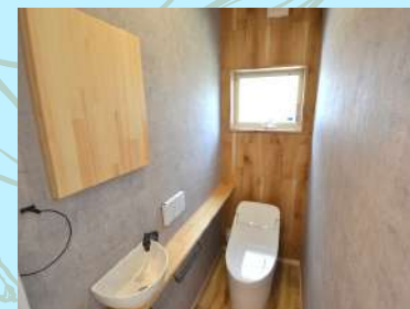
ウォシュレット付きトイレ

毎日の身支度を行う洗面台は、使い勝手はもちろんのこと、おしゃれさも追求したいですよね！ワクワクプロジェクトはよくあるユニット式洗面台ではなく、洗面台にもおしゃれさを追求しています。