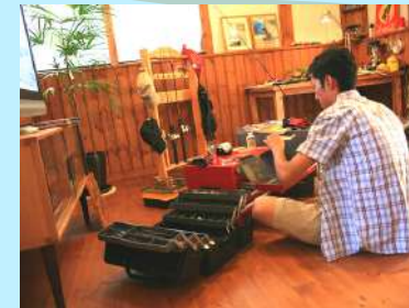
プラスαのボーナス空間

空間作りで大事なこと。それは、せっかく床や壁をおしゃれに仕上げてもお部屋を彩る家具・雑貨・照明器具を入れなければ空間の全体像が見えません。当社では家具や雑貨、照明器具までこだわって空間づくりをしています。