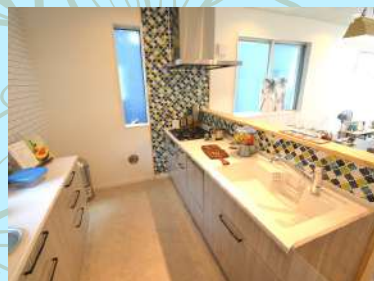
食洗機付きシステムキッチン

1坪タイプのバスルームでゆっくりとバスタイムを楽しめます。さらに、浴室乾燥暖房機がついているので、雨降りのお洗濯にも役立ちます。