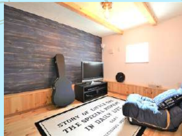
各部屋楽しめるアクセントクロス

木の温もりを感じる無垢の床材を標準採用しています。夏は涼しく、冬は暖かく、木の温もりを直接肌で触れて感じてみてください。そして、経年による表情の変化もお楽しみください。