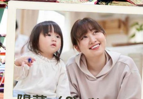
陽菜 (3) 藍 (30)