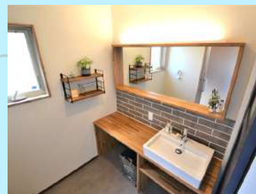
おしゃれな洗面化粧台

現代社会では共働き夫婦が増え、日々の家事も分担して行う事が多くなりました。そんな共働きのご夫婦の負担を和らげる食洗器が標準装備。これならパパでも簡単にお皿洗いができますね！