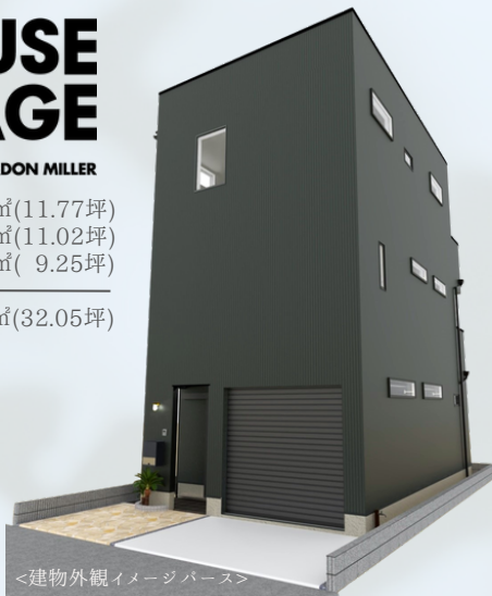
<建物外観イメージパース>