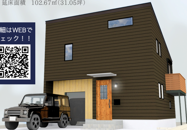
〈建物完成イメージパース〉