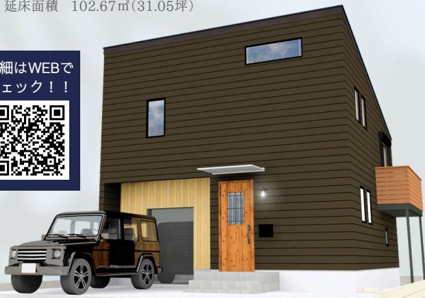
〈建物完成イメージパース〉

【アウトドアストッカー】※イメージ ガレージライクに使えるアウトドアストッカーは バイクやサーフボードなどのメンテナンスや、ア ウトドアアイテムの収納にも大変便利☆秘密基地 のような空間です。