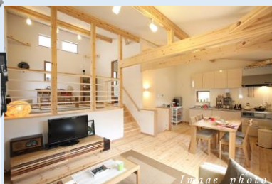
どんな場所にもフィットする スキップフロアの家

シャープな片流れ屋根とシンプルでモダンなフォルム。すっきりスマートだけれど、力強さを感じさせる外観。「街なかで便利に暮らしながら心地よく」をコンセプトに、スタイリッシュなボディをまとったWAVEは暮らしそのものを輝かせることを重視した住まい。モダンな建物は、街なかでも美しく個性を際立たせる。暮らしを自由に楽しみたい人たちのための新しい提案です。