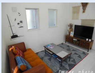
セカンドリビングは フレキシブルなスペース